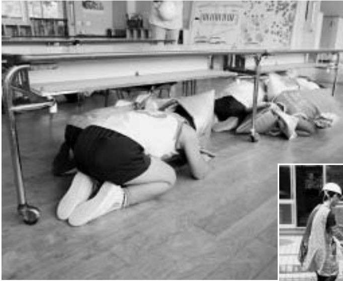
▲地震だ！机の下に隠れろ！

9月1日は防災の日です。各保育所では、地震や火災、台風など、災害に備えて様々な訓練を行っています。8月20日（水）、関保育所では地震が発生したという想定で避難訓練を行いました。園内に「地震が起きました」と放送が流れると、子どもたちは素早く防災頭巾をかぶり、できるだけ体を小さくして机の下に隠れました。しばらくしてから、揺れがおさまってもまた余震があるかもしれない