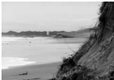
一夜にしてできた浜崖は目立つが

さらに、どんなに高度な土木技術であっても、自然が人工構造物を受け容れ、なじむまでには時間がかかります。技術者は、人間の尺度で自然を制御するのは困難だということも心得ているはずですが。