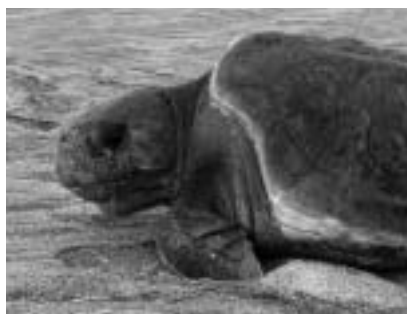
最多記録を更新した白子海岸のアカウミガメ

アカウミガメが卵を産むまでに三十年かかることは、内外の研究で分かっています。今年の全国的な増加が保護活動の成果だとすれば嬉しいこ