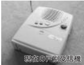
現在の戸別受信機

町では、町内55か所に防災行政無線の屋外拡声子局（パンザマスト）を設置していますが、聞こえにくい地域もあり、希望する世帯には戸別受信機を設置していただいています。この度、戸別受信機の在庫が少なくなりましたので製作します。希望される方は総務課へお申し込みください。