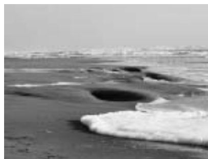
大潮の日 剃金海岸にて

前回、アカウミガメが卵を産むまで三十年かかると書きましたが、今年の日本ウミガメ学会（十一月二十八日）では、アカウミガメ五〇頭の死骸を調査・研究した東大の研究者たちが、産卵可能なアカウミガメの平均年齢が、四二歳に達していたことを明らかにしました。 性成熟（卵が産めるからになる）まで海の中で四十二年間、やがて北太平洋唯一のアカウミガメ産卵地である日本を目指し、厳しく長い旅を