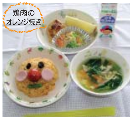
鶏肉の オレンジ焼き