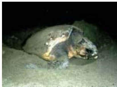
白子海岸のウミガメ 2001年

ブロックの撤去一つを見ても海の営みそのものである侵食の複雑さがよく分かります。侵食が進むからといって安易に消波ブロックを投入した時代は終わった、と考えます。四月八日「九十九里浜の自