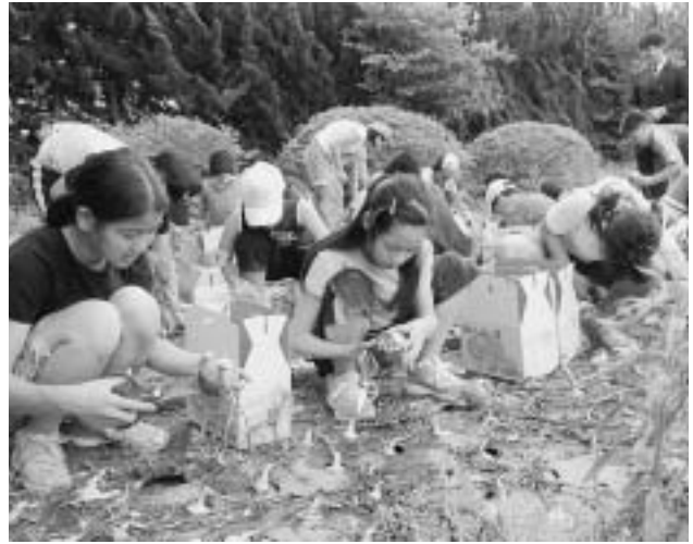
▲たまねぎを収穫する小谷村の小学生たち

5月24日には姉妹都市の長野県小谷村の小学生が修学旅行で訪れ、たまねぎの掘り取りを体験し、収穫したたまねぎをお土産に持ち帰りました。「みなさんが丹精込めて育てたたまねぎをありがとうございます。」と話していました。