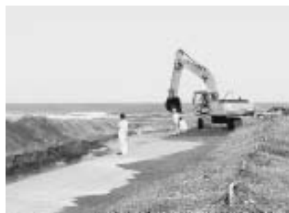
南白亀川河口の砂を取り除く

先日のNHKテレビ「海岸線の危機」砂浜が消える”では、解説者が「侵食対策が新たな侵食を生む」と語っています。九十九里浜のようにひと続きの砂浜では当然のことだと思っています。