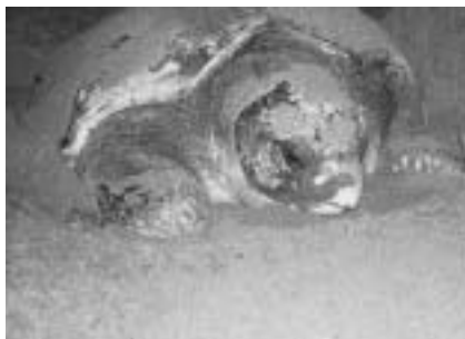
白子海岸に上陸したアカウミガメ

千葉県の環境講座で同期だった知人が移住した屋久島の永田地区では、六月一日時点でアカウミガメ一〇〇〇頭の上陸・産卵を確認した、和歌山県の串本町では昨年の台風