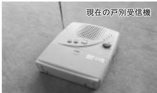
現在の戸別受信機

この度、戸別受信機の在庫が少なくなりましたので、新しく製作するため希望者を募集します。設置を希望される方は、総務課へご連絡ください。なお、製作には3か月ほど期間がかかりますのでご了承ください。