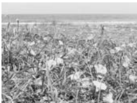
▲砂浜に広がるハマヒルガオ

太平洋に面した白子町には約6kmの砂浜があります。この時期の海岸はハマヒルガオが咲き誇り、海水浴シーズンとはまた違った趣があります。この美しい景観を守ろうと、6月9日(木)午後、白子中学校の生徒たちがボランティアで海岸清掃を行いました。