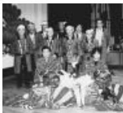
南日当無形文化財保存会

昭和44年、町の無形文化財に指定され、翌年に保存会を設立。現在は月二回の練習を行い、文化財の伝承と後継者の育成に努められ、また、お正月には特別擁護老人ホームを訪問するなど地域に密着した活動を続けています。