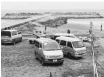
北九十九里海岸・旭市の人工岬

ごとに写真を撮っています。人工岬との位置関係から直接影響はなくても複雑な沿岸流に変化が生じ白子海岸に好影響をもたらすかもしれないと期待しました。しかし南九十九里海岸全体の侵食は止まら