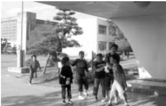
元気な子どもたち

国の補助はあると思いますが、町村会でも議論してもらおうよう働きかけたいと思います。生活困窮者については指針が出ていませんが、出た段階で対応したいと思っています。