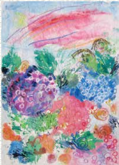
「アジサイとわたし」