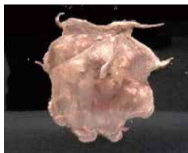
海の博物館 深海展より

こうして「海」は日本人の心の中で生きていくわけですが、旅客機で海外旅行をする現代、海に対する意識は徐々に変わってきていることも確かです。世代にかかわらず、