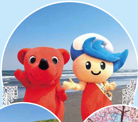
子町の マスコット チキマ くん