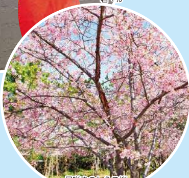
早咲きのしらこ桜