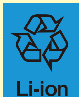
Li-ion リチウムイオン電池

リサイクルマークの表示を義務化する前に製造された製品は、リサイクルマークがついていないものもあります。以下のような表示の電池も回収・リサイクル対象です。