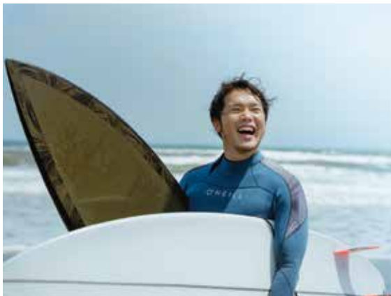
▲休日はサーフィンを楽しんでいます

応援歌は、白子町ホームページからダウンロードできます。また、歌詞や譜面もダウンロードできます。