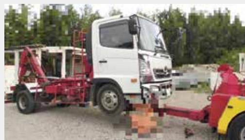
▲茂原県税事務所による差押え自動車の引揚げ例