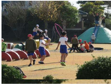
↑ 縄跳びをする高学年児童