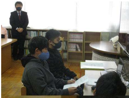
↑ カメラの前で発表する様子

限られた時間での発表でしたが、6年生が分担してしっかり取り組んでいました。今後、保護者の方々にも参観していただけるといいなと感じています。発表会の終わりには、発表の内容について、よい発表であったとの講評をいただきました。