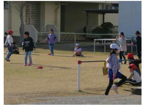
↑ 縄跳びをする中学年児童