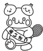
白濁小マスコットキャラクター「しらっぼん」