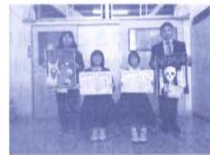
表彰伝達 (於 東中学校)