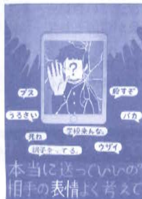
佳作 市立富士見中2年 東條 未玲