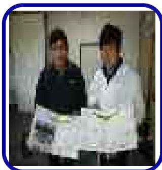
6年生「感謝の言葉集」をまとめ宮司さんへ。