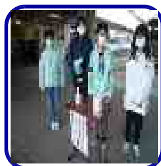
毎朝の児童会活動の「あいさつ運動」