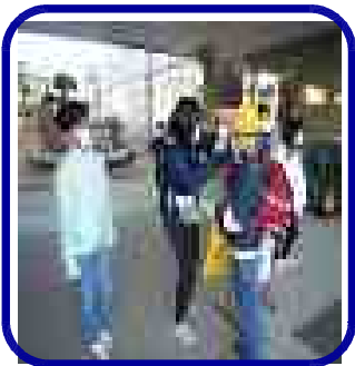
毎朝の養護教諭との「健康ふれあいコーナー」