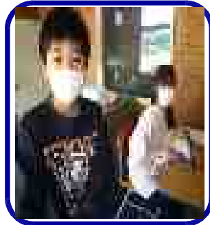
毎日の給食時の放送での「ふるさと応援歌」発信。