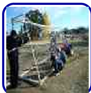
職員全員で、サッカーのネット修繕と補強作業の様子。