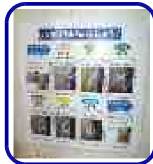
手洗いのポスター掲示。