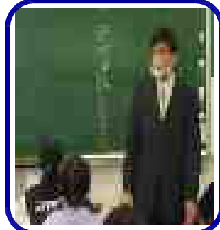
5年生「キャリア教育アナウンサーの講話聴く。