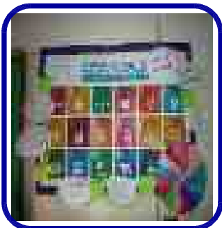
SDGs：エスディー・ジーズ みんなで協力して取り組む目標の掲示。