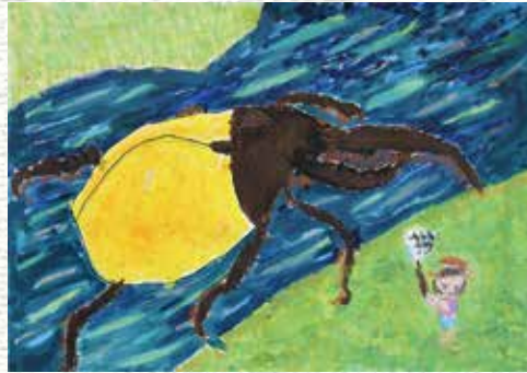
「わたしの大きな虫」

(評)ウナギの放流に参加して、とても楽しかったことが伝わってきます。ウナギをつかもうと手に力を入れる様子が表情豊かに描けました。