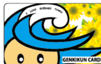
げんき君カードチャージ券 (イメージ)