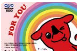
チーバくんQUOカード