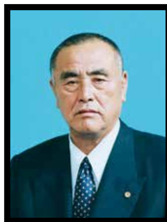
(享年77歳・牛込東) 令和4年1月22日逝去

ここに、故今井氏の長年にわたる功績を称えとともに、心からご冥福をお祈り申し上げます。