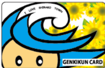
げんき君カードチャージ券 1pt = 1.5円