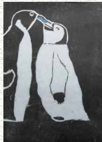
「親子ペンギン食事中!!」