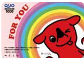
チーバくんQUOカード 1pt = 1円