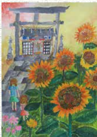
「夕焼けに照らされる向日葵達」

評)花の1つ1つに表情がでるよう、形や色の変化を工夫してかきあげることができました。