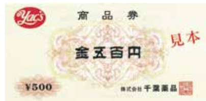
ヤックス商品券 1pt = 1円