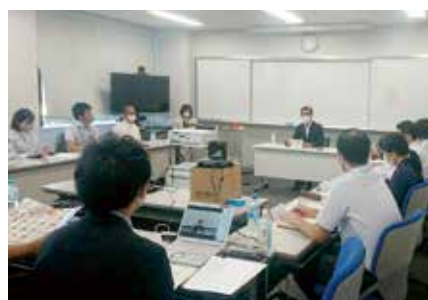
▲受講生に対し、町の課題・現状を報告している様子