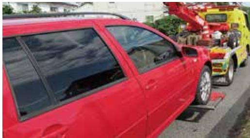
▲差押え自動車の引揚げ例

県税・市町村税の収入未済額の圧縮および滞納の発生を防止するため、「滞納は絶対に見逃さない」を合言葉に、千葉県と県内全54市町村は10月から12月を「千葉県下一斉滞納整理強化期間」として、県税・市町村税の滞納者に対する徴収対策(文書催告や勤務先・取引先などへの財産調査、自宅などの搜索、給与・預貯金などの差し押さえ、自動車のタイヤロック)を強化しています。 税金は納期限までに、必ず納めましょう。