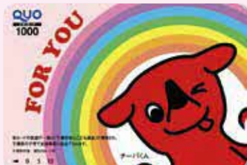
チーバくんQUOカード