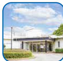
主催：大多和医院 医療に求められる医療 提供と町の活性化に尽 力して参ります。