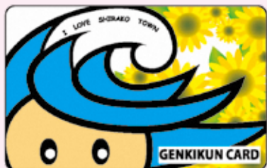
げんき君カードチャージ券