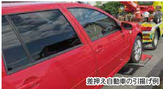
差押え自動車の引揚げ例

問い合わせ (県税) 各県税事務所または県税務課 ☎043-223-2127 (市町村税) 税務課 ☎33-2114