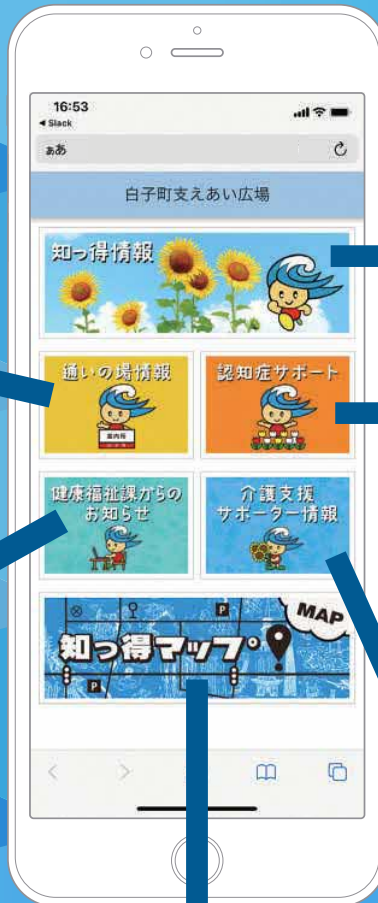
< 知っ得マップ > 通いの場・生活支援情報