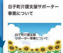
< 介護支援サポーター情報 >