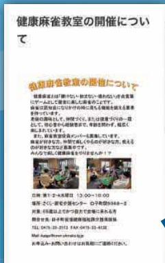
< 通いの場情報 >