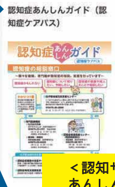
< 認知サポート > あんしんガイド、 認知症カフェ情報など