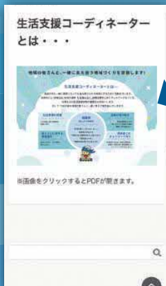
< 健康福祉課からのお知らせ >