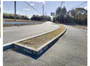
所管は生涯学習課

町長 今年度から花の広場の管理等を環境課へ所管替えをし、美しいまちづくりの推進を図りました。以前から設置されている美しいまちづくり推進委員会を活用し、花の種類や播種の時期等を協議して進めています。 県道30号線の海岸沿いの緑地帯については、商工観光課が所管、白子中学校通りの緑地帯については、生涯学習課が所管となり進められています。統一をさせて主管課を決めて取り組んだ方が良いと思いますので、検討していきたいと考えています。