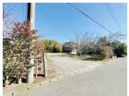
南白亀保育所跡地の現状

議員 防火水槽の撤去の問題、一般貸出しでの駐車場利用等で整備が進んでいないようですが、今後の見通しを伺います。