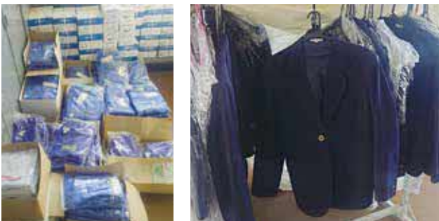
一時貸し出し用の制服

中学校と教育委員会で相談をしながら、リユースということで検討していければと思っております。