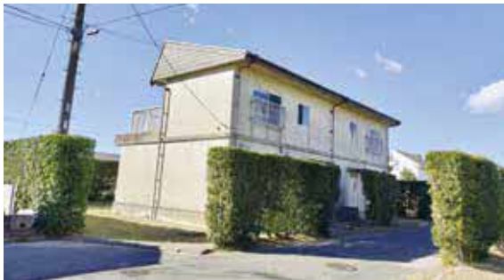
空室となっている古所住宅