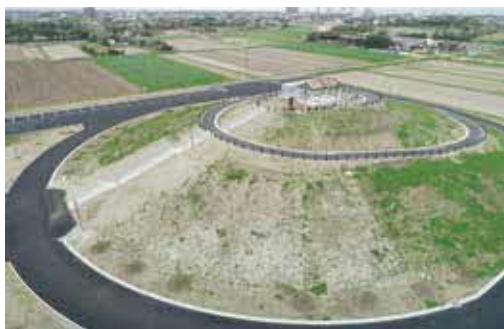
津波避難施設の築山

難施設の築山を普段は子供達がグラススキーなど自由に遊べる場、子育て中の親同士の交流の場として、公園的要素を導入する考えがあるかを伺います。