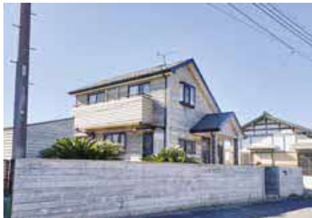
お試し住宅の現状

企画財政課長 変更前に問題ないと確認しています。また、地域おこし協力隊員の居住は最大で3年程度の任期中となります。