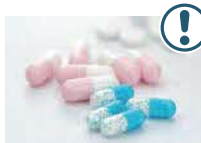
医薬品の多量摂取