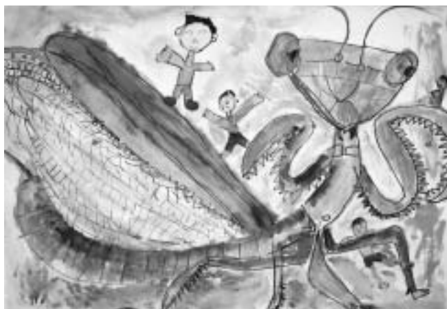
カマキリとあそんだよ