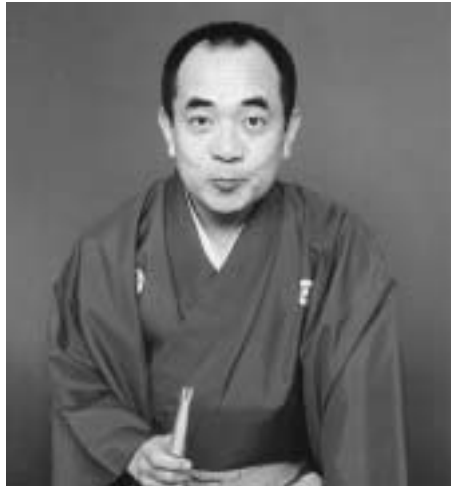
▲三遊亭小遊三 (日本テレビ系『笑点』でも活躍中！)

出演 三遊亭小遊三 他 【全席自由】 と き 2月8日(日) 開場14:00 開演14:30 ところ 青少年センター・ホール 入場券 前売券 一般 1,500円 65歳以上 1,000円 当日券 一般 2,000円 65歳以上 1,500円 前売りで完売した場合、 当日券はございません。 【1月6日(火)から青少年 センターで取扱います。】 主催：白子町 問い合わせ：生涯学習課 ☎33-2111 (内422)