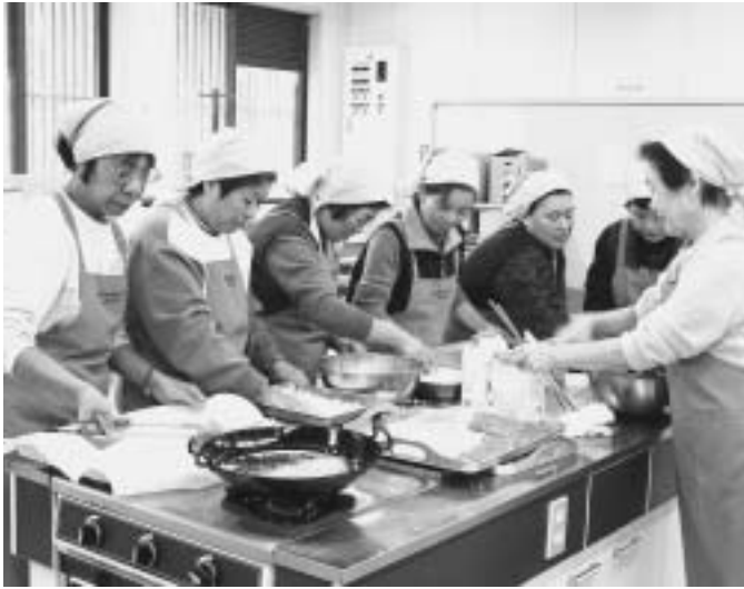
▲衛生面にも気をつけ、手洗い・うがいを励行しています。