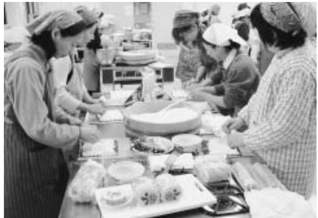
▲真剣にお寿司を巻く参加者

以前は冠婚葬祭などの時によく作られていた太巻き寿司ですが、最近では巻ける人も少なくなつたようです。