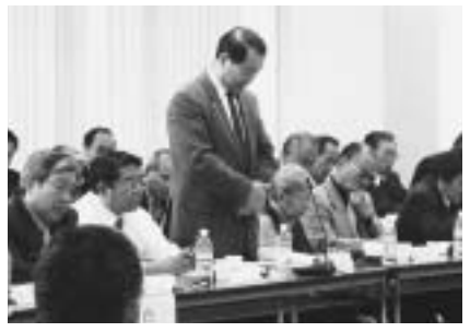
▲意見を述べる町長

第4回長生郡市合併協議会が12月10日(水)、長南町で開かれ、新市の名称や町・字名の取扱など9項目について協議されました。