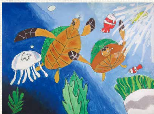
南白亀小3年 さい 齊 とう 藤 り 璃 の 音

⑨海の中で自由に泳ぐウミガメを描きました。差し込む光や亀の甲羅の模様などをクレヨンを使い、上手に仕上げることができました。