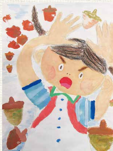
白潟小3年 いい 飯 じま 島 つむぎ つむぎ

⑨海の中で自由に泳ぐウミガメを描きました。差し込む光や亀の甲羅の模様などをクレヨンを使い、上手に仕上げることができました。