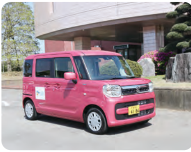
らくらくタクシー

また、継続的な事業としていくために、事業者の意見も聞かなければならないと思っています。