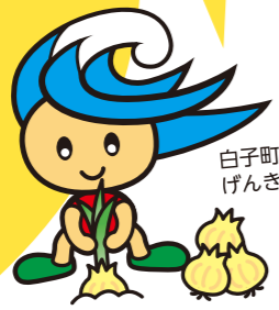
白子町シンボルキャラクター げんき君