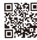
白子町観光協会 公式Instagram