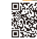
第23回おいしい一番 「白子たまねぎ」祭り

白子たまねぎ祭りのお問合せ 白子町役場 商工観光課 tel.0475-33-2117