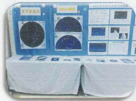
白子天文サークル