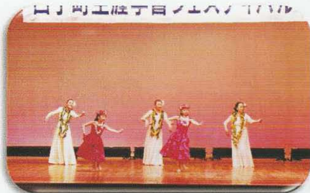
レファTOYOKOカーホナオレ