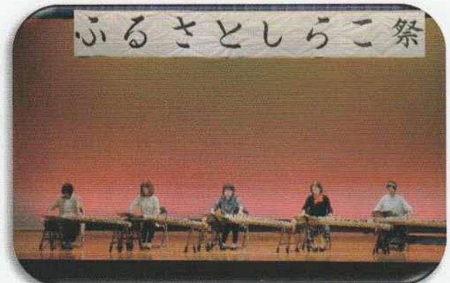
お琴サークルつむぎ