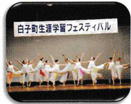
力強く踊るダンス部員