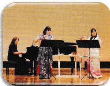
コンサートでの蝶和

茂原市出身・在住。国立音楽大学音楽教育学科卒業。ピアニストとしての演奏活動、音楽ボランティア、合唱指導、シニアキーボード教室など、活動は多岐にわたる。クミピアノ教室主宰。茂原市音楽協会副会長。