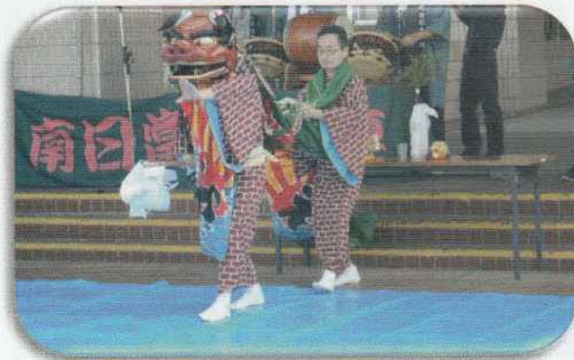
南日当獅子舞保存会