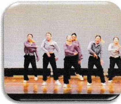
茂原北陵高校ダンス部