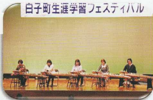
お琴サークルつむぎ