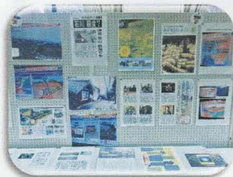
白子町の文化財を守る会