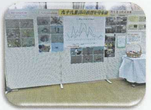
九十九里浜の自然を守る会