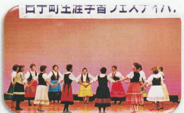
フォークダンスサークル