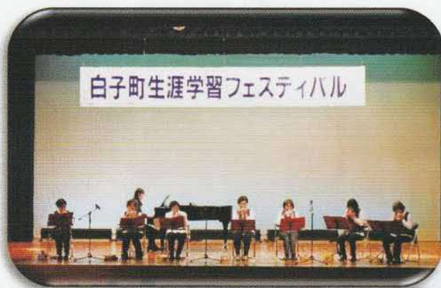
オカリナサークル