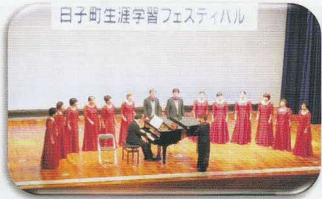
コーラスサークルコールヴィント