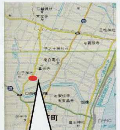
鎌田の御塚山 剃金字鎌田

白子町役場から剃金西区を通る道路の東約三十メートルのところに、南北にかまぼこ型の塚が横たわっている。以前は、松林におおわれていて、古墳のように見えていた。東北の隅に ほころ 祠があつたが、今は、祠は朽ち果てて、雑木におおわれている。