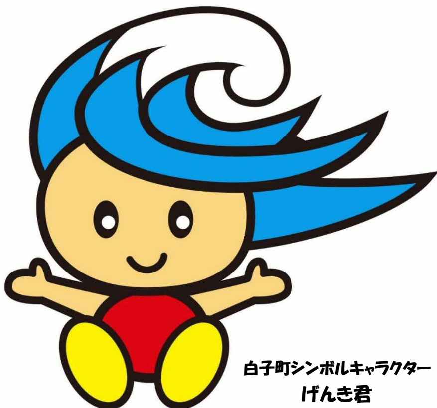
白子町シンボルキャラクター げんき君