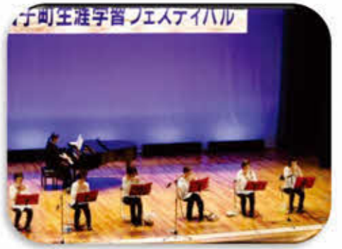
オカリナサークル