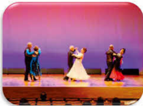
白子ダンスサークル