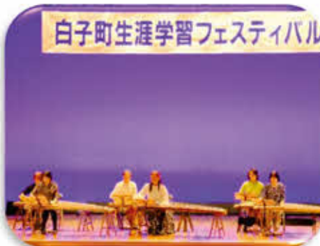
お琴サークル つむぎ