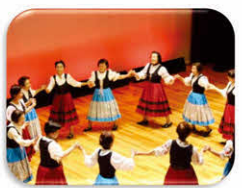
白子フォークダンスサークル