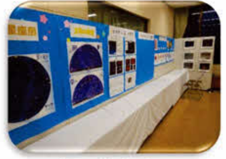
白子天文サークル