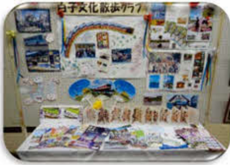
白子町文化散歩クラブ