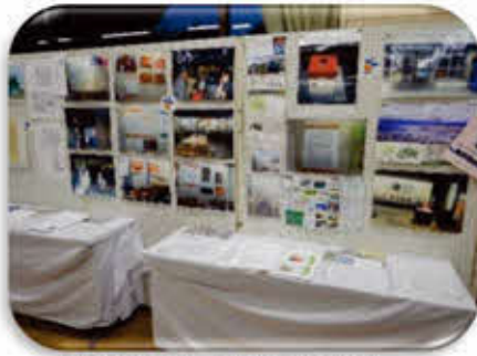
白子町の文化財を守る会