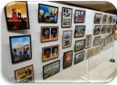
地域おこし協力隊