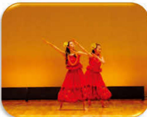
トヨコ カーホナ オレ