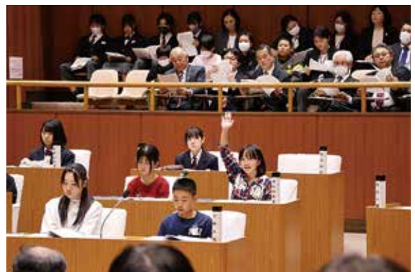
多くの傍聴人が見守る中、しっかりと出来ました。