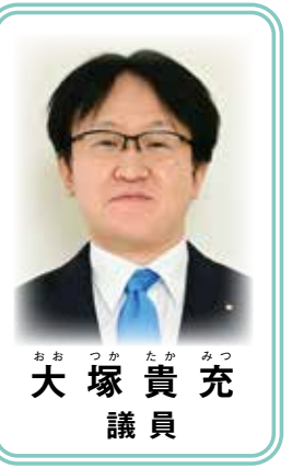
大塚 貴充 おお つか たか みつ 大塚 貴充 議 員