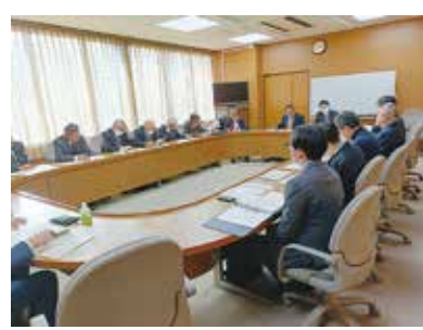
しっかりと進捗状況を確認し、意見交換することでより良い設計に寄与します。