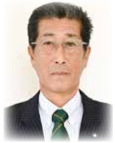
あき ば ひろ ゆき 秋 葉 広 行 議 員