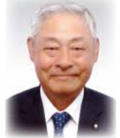
たか やま りゅう いち 高山 隆一 議員