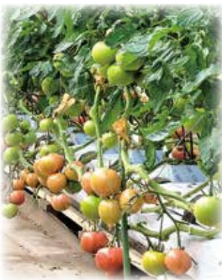
高い生産性を求めて

答 近年、人材の確保は官民間問わず困難な課題となっております。職員の能力の向上、モチベーションの維持等を考慮しながら、業務が効率的に好循環されていくよう配置しています。