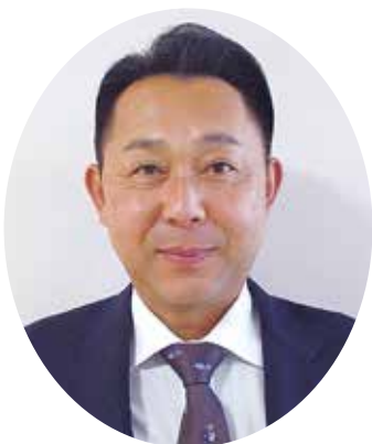
第40代副議長に就任した今井滋則副議長